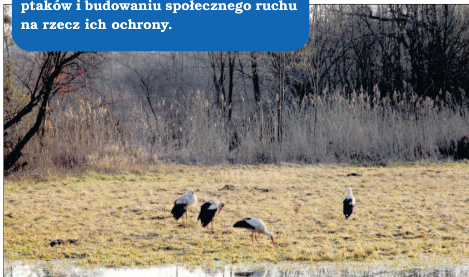
Bociany tuż po przylocie na Dolny Śląsk.

PTPP PRO NATURA zajmuje się ochroną bociana białego i jego siedlisk od 1994 roku. Realizowane w ramach tej działalności programy i akcje polegały m.in. na renowacji gniazd, odtwarzaniu i utrzymywaniu bocianich żerowisk, edukacji społeczeństwa, monitorowaniu liczebności polskiej populacji tych ptaków i budowaniu społecznego ruchu na rzecz ich ochrony.